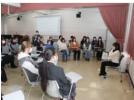
読み聞かせ体験授業