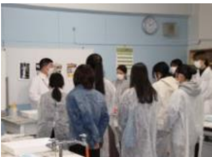
イカの解剖体験授業