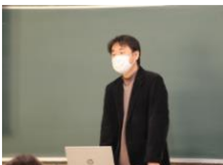
就職状況などの説明