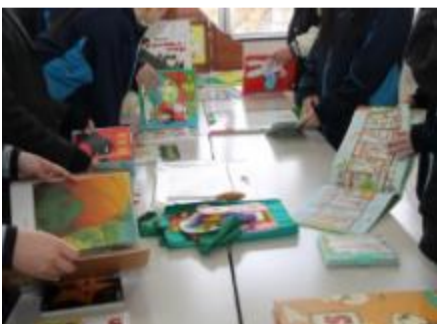
いろいろ絵本比べ