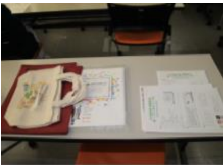
本学特製バッグと資料