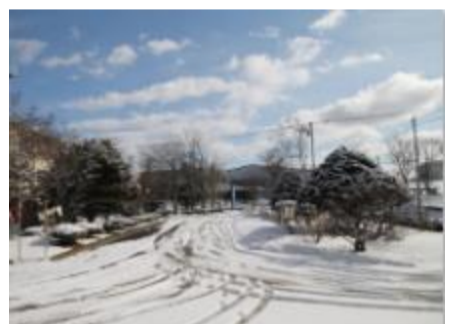
雪もすぐに解けました