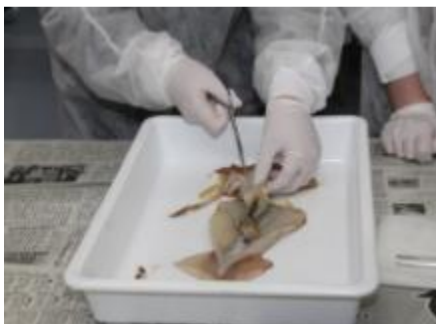
参加者がやってみました