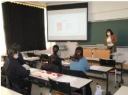
生活科学科 生活科学専攻