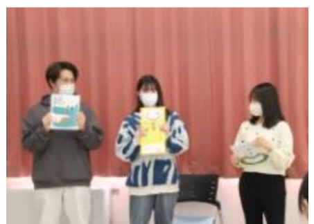
読み聞かせのポイントは？！