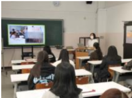
生活科学科 食物栄養専攻