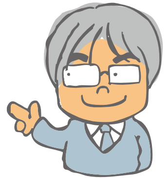
学長 杉本 龍紀